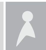
Pascal LIABASTE (Agroalimentaire)