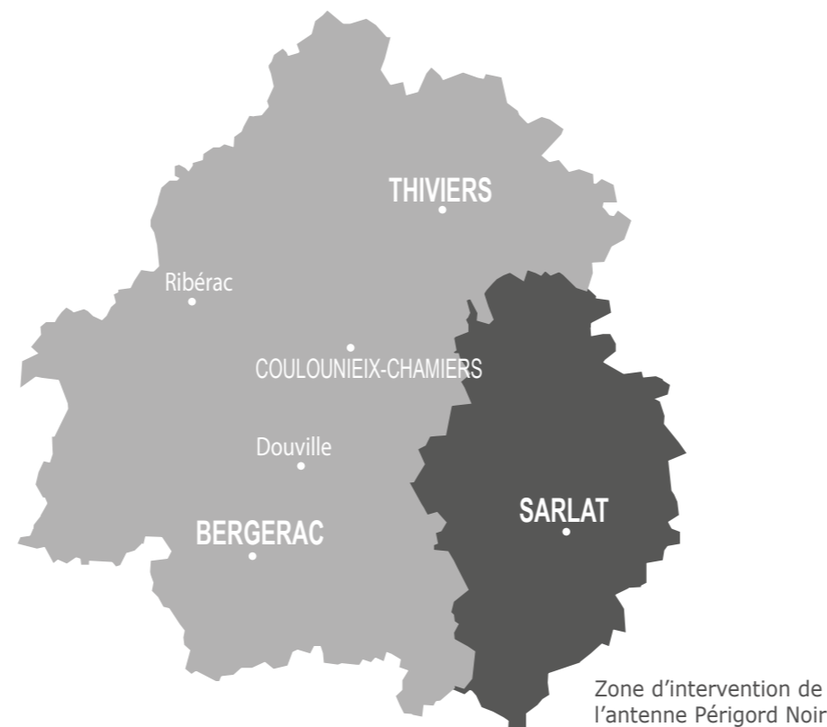
Zone d'intervention de l'antenne Périgord Noir