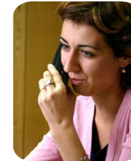
Toutes les lignes directes