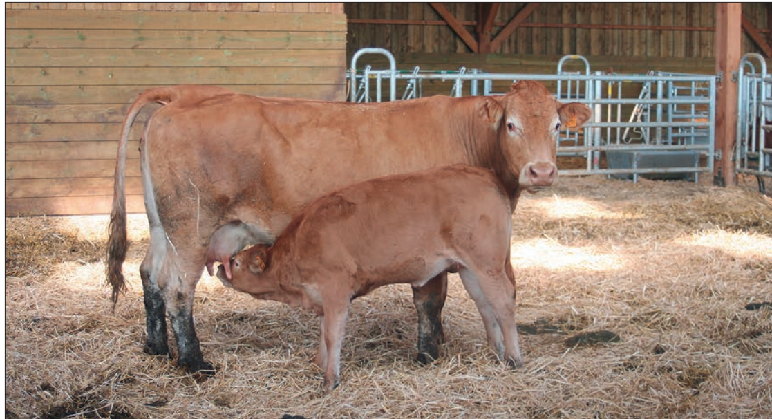
Les aides couplées bovines sont regroupées dans un nouveau dispositif à l'UGB.

Les montants des aides couplées végétales seraient stabilisés