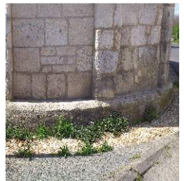
L'église : entretien des pieds de murs