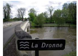
La Dronne à Petit Bersac