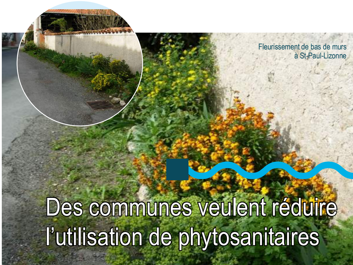
Fleurissement de bas de murs à St-Paul-Lizonne

Président du Conseil général de la Dordogne