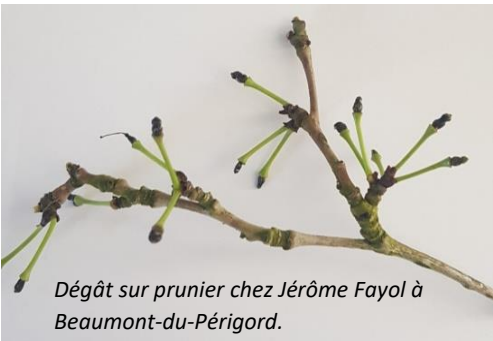
Dégât sur prunier chez Jérôme Fayol à Beaumont-du-Périgord.