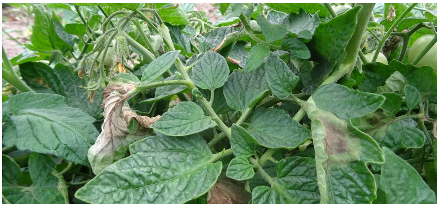
Mildiou sur culture de tomates