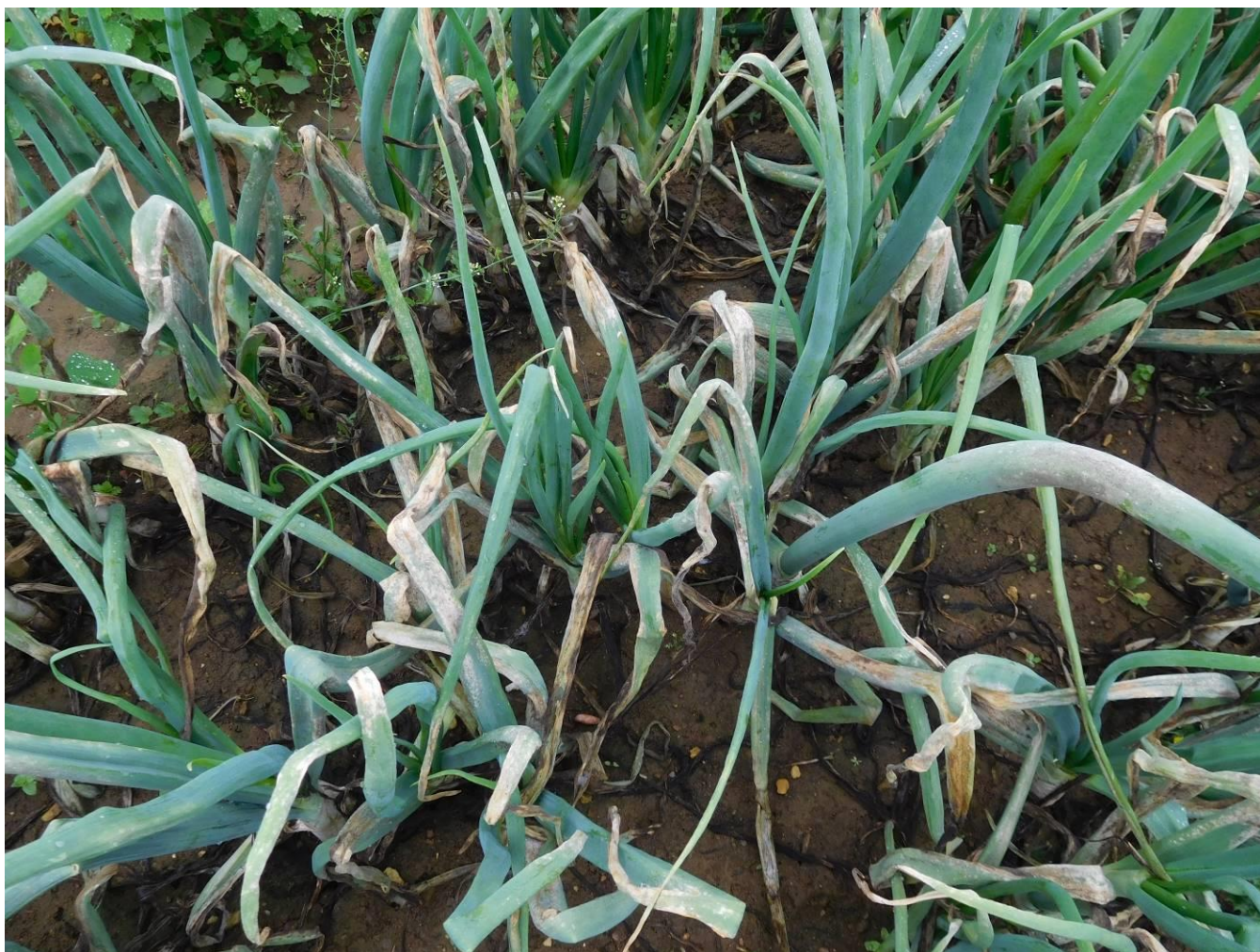
Mildiou sur culture d'oignons