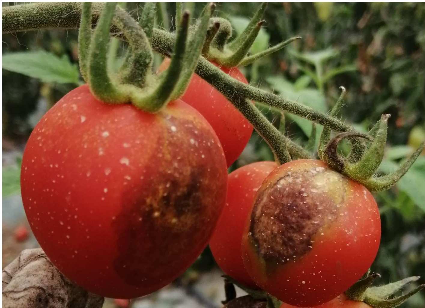
Dégâts caractéristiques de mildiou sur fruit de tomate.