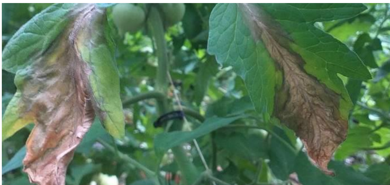
Mildiou sur culture de tomates