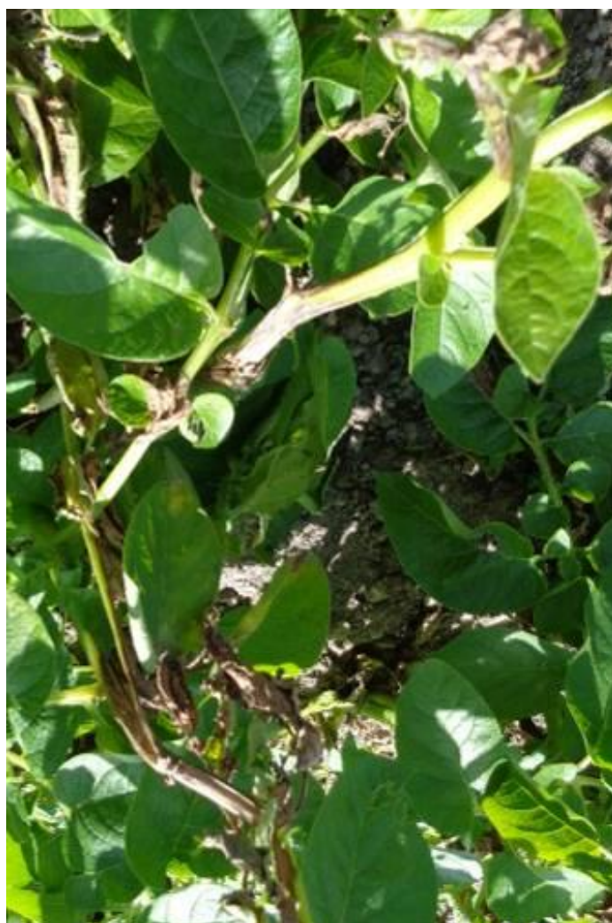
Mildiou sur tige de pommes de terre